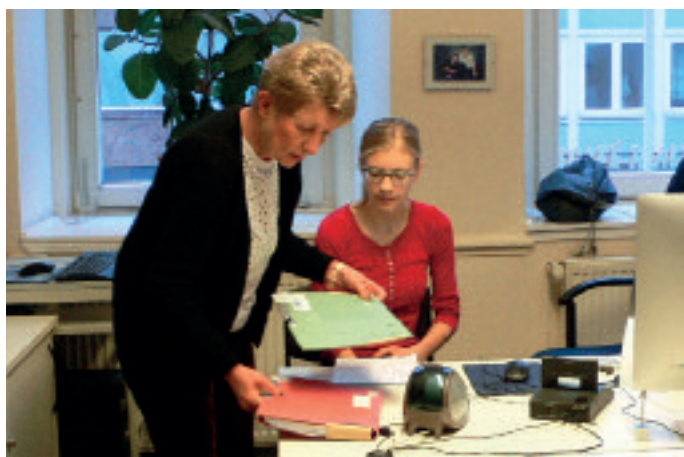
Im Schreibbüro sind Erfahrungen aus einer Tätigkeit in einer Anwaltskanzlei hilfreich. Gearbeitet wird beim Mieterverein mit Windows und MS Office