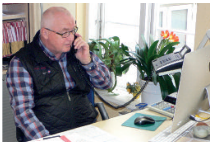
In der Rechtsberatung sind gute juristische Fachkenntnisse und eine hohe soziale Kompetenz unerlässlich