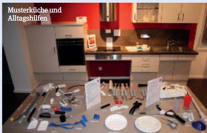
Musterküche und Alltagshilfen

Seit Dezember 2012 gibt es in Lübeck die Wohnberatung „Wohnen im Alter“ am Kolberger Platz 1 mit einer breiten Palette an Informationen und Anschauungsmaterialien. Mieter oder deren Angehörige können sich hier einen Überblick verschaffen über Hilfsmittel, Wohnraumanpassungsmaßnahmen, Förderprogramme und Serviceangebote, die dazu beitragen sollen, auch im hohen Alter und trotz Einschränkungen in der Beweglichkeit möglichst lange in der eigenen Wohnung und der vertrauten Umgebung verbleiben zu können.